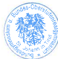
Mag. Brigitta Krimbacher Direktorin

das Original des Jahreszeugnisses der 4. Klasse Volksschule der Direktion vorgelegt werden (per Post oder persönlich). Achtung: Postkasten links vom Haupteingang